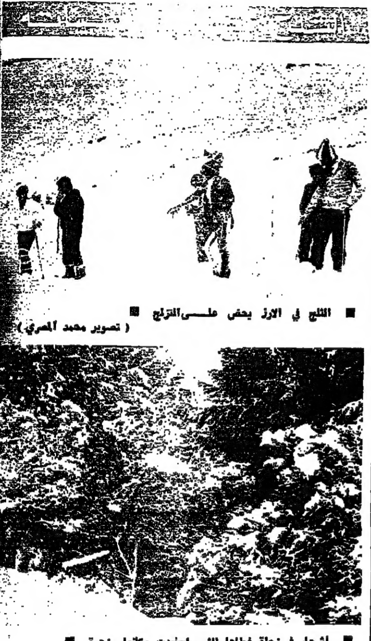
الحجار في زلحة لظاهما الثلجيات وكلمها مزهرة (صورة من مراسل «الانوار» في رحلة)

المعربي بانشاء الاجيرة التنقيبية . مشروع الاعلان وبرنامج العمل التعاون الاقليمي العربي . بيان الختامي للمؤتمر . تحديد موعد انعقاد مؤتمر القمة الثاني . وقد انتهت امس الاستعدادات لمعد المؤتمر واستقبال الرؤساء وزدانت شوارع القاهرة باعلام الدول العربية الايقية . كما رفعت هذه الاعلام على مقر المؤتمر والطاقات التي يغزل بها الملوك والرؤساء . وتم توزيع بطاقات مرور خاصة لاصحاب الرؤساء والصحفيين . وقد تم تخصيص خطي اميريين وجنود للرؤساء والمسوك بينما خصصت قاعات شيرد وشيراتون وميناهوس للفؤود وخصي فندقا للتيل وكولونيات والبرج للصحفيين والفؤود الاعلامية . وهيئة القمة ويكتب مؤتمر القمة الايقية - العربية في كل الواع العربي . والايقية والمالي في هذه الفترة . امية سياسية واقتصادية خاصة . يفصل عدد من الاسباب الرئيسية . فعمل امس العربي . يستقبل المؤتمر انهما عربيا خالصا . لانه ياتي بنما تير قضية الشرق الاوسط ببرنامجا ملية وحاسمة . فالاستراتيجية العربية تخوض تحركا جديدا يستهدف عقد مؤتمر جنيف . واحكام الحصار السياسي حول اسرائيل وفتح موقفا الموقول للسلام الدائم والقائم على العدل في الخطة . ومن يمل المؤتمر امية خاصة لدى القيادة العربية التي تبل جودا